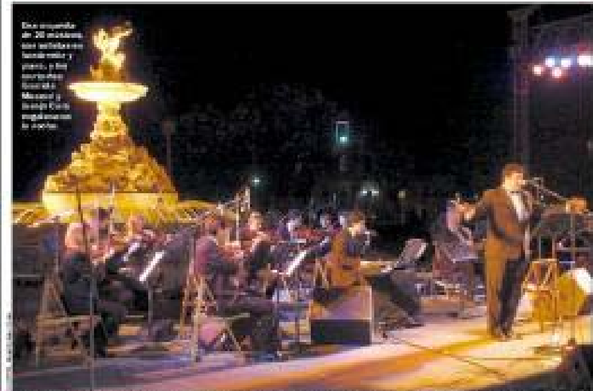
NACE UNA POSTAL. Se inauguró anoche con música la remozada Fuente de las Utopías, núcleo de un paisaje urbano excepcional al lado de la ex Aduana y frente al río. Más de mil personas gozaron de un exquisito programa de música clásica, tango y jazz. Una velada emotiva e inolvidable. P 8

■ Posee datos que permitirían entender las causas de la tragedia. También encontraron un diario de la niña que sobrevivió. P 30