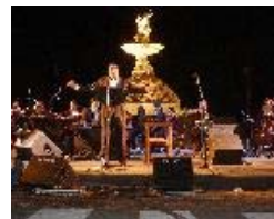
Anoche, Juanjo Cura sedujo al público con su voz en el concierto brindado de cara al río.